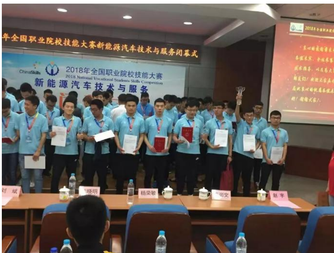
在各项技能大赛中取得优异成绩