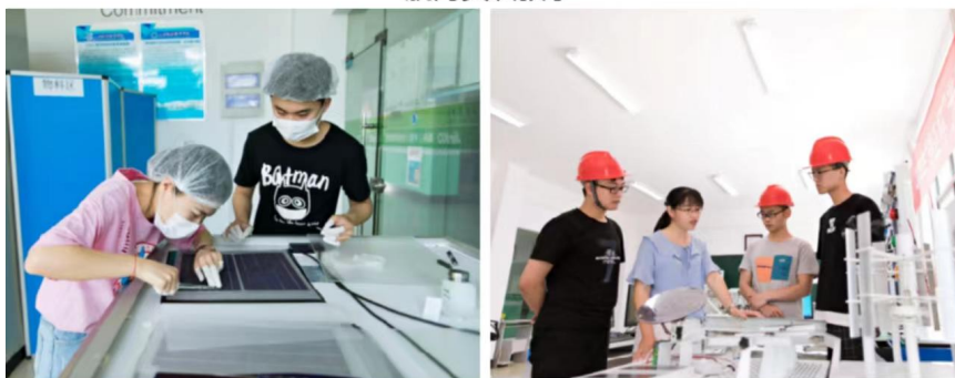
光伏电子实训教学