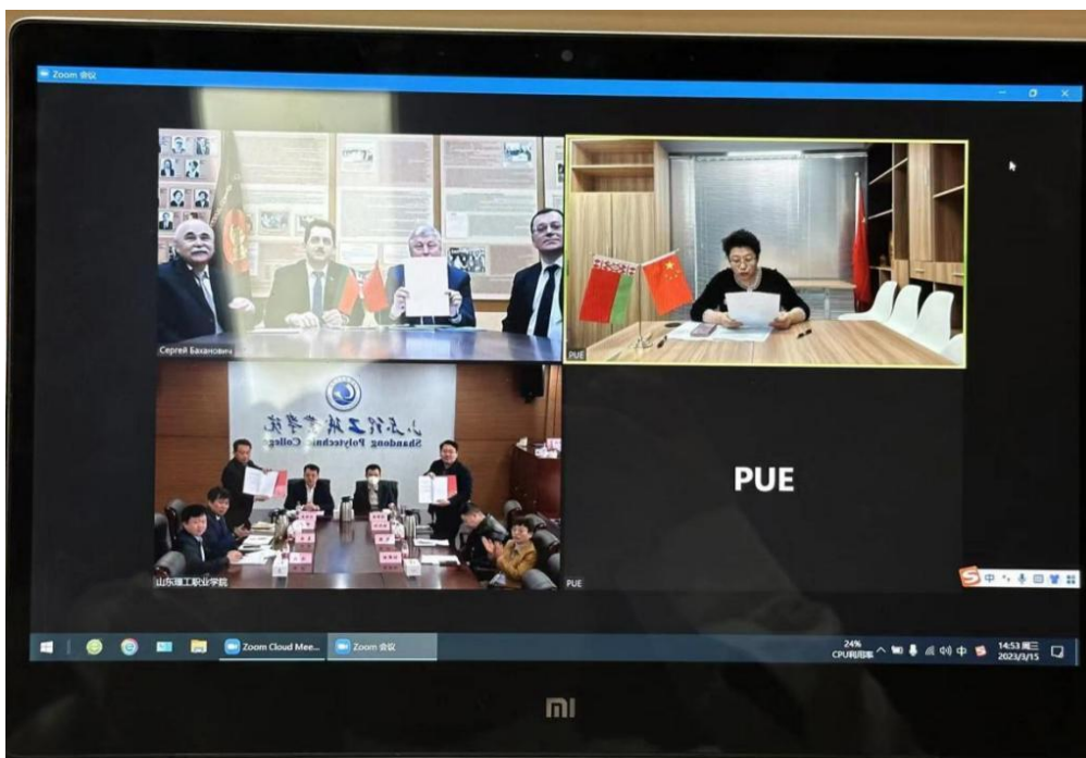
签署战略合作框架协议现场

仪式上，山东理工职业学院、太白湖新区管委会、白俄罗斯科学院三方签署了战略合作框架协议；山东理工职业学院、太白湖新区管委会、白俄罗斯国家科学院信息问题研究所数学控制联合实验室主任图齐科夫三方签署了院士工作站共建协议。