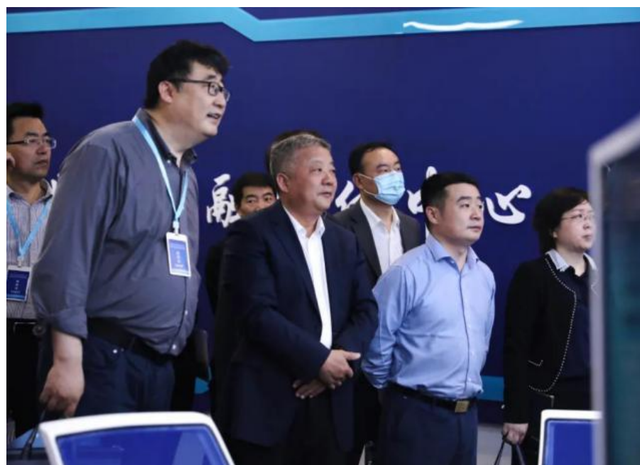
与会领导在展区详细了解学院国际化办学成果