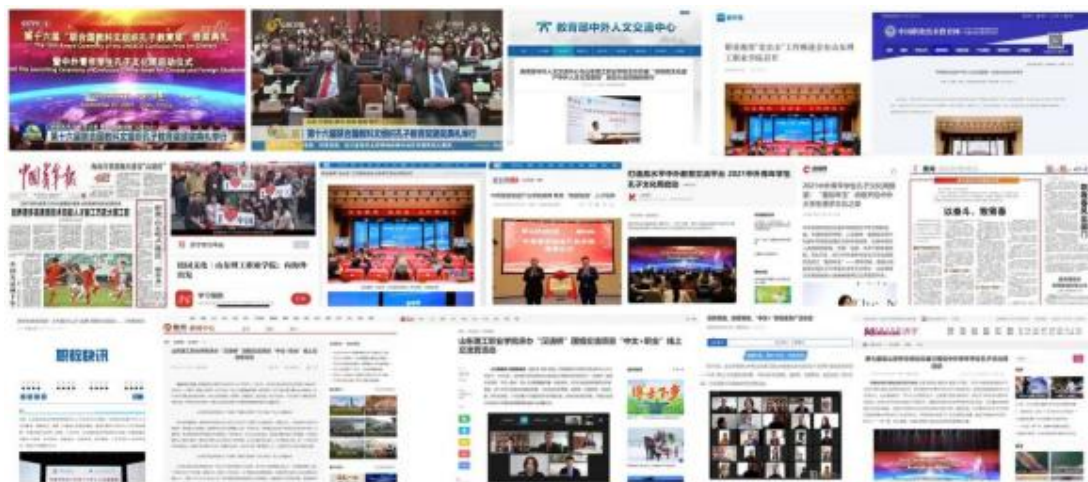
国内主流媒体聚焦学院国际化办学发展

我院开展国际化办学，培养具有“世界眼光、国际标准”的国际化人才。先后与德国、英国、澳大利亚、韩国、俄罗斯、泰国等国家的 70 所海外高校和科研院所建立友好合作关系，举办教育部批