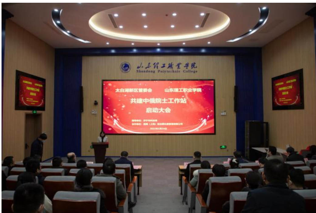
揭牌签约仪式现场

以及一个中俄技术转移中试基地。“一站一基地”将以济宁产业发展及企业需求为导向，将国外先进的技术引进国内，对接一批高质量、高起点科创项目，并服务项目落地产业化，全面助力新区企业实现技术转型升级。