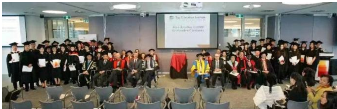
合作院校毕业典礼

农业农村局等合作成立乡村振兴学院，校办企业理工昊明建设乡村光伏电站一批，开展“送技下乡”活动，开展中药材种植、电子商务等培训 8669 人，带动农民增产增收。免费植保 1300 亩。完成 6 期退役军人 198 名学员的职业技能培训。开展在校大学生职业技能培训，合格人数达 186 人，通过率 100%。先后为 10 余家单位技术培训近万人。学院成功获批船员培训资质，取得了航海类专业人才培养的“金名片”。