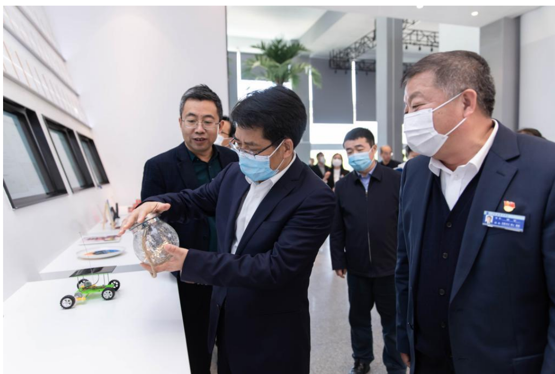
邓云锋厅长莅临我院实地调研创新发展工作

任务，统筹抓好疫情防控和教育教学工作，深化教育教学改革，打造高水平双师队伍，全面加强对外交流合作，全面实施高质量发展战略，建设文化校园、文明校园、智慧校园，各项工作都取得了全面进步，在2021年2月山东省教育厅公布的2020年度山东省高等职业院校办学质量年度考核结果中，学院考核等次为A等，位列全省83所高职院校第11名。