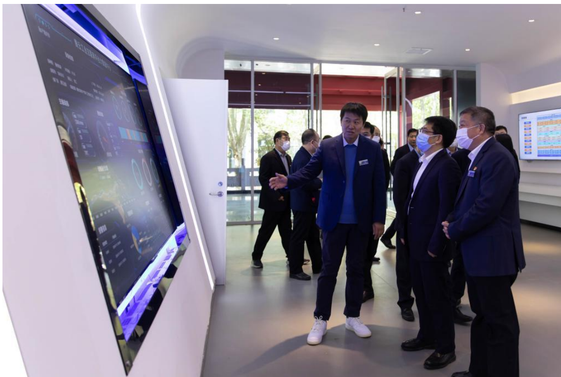
参观物联网产教融合推进中心