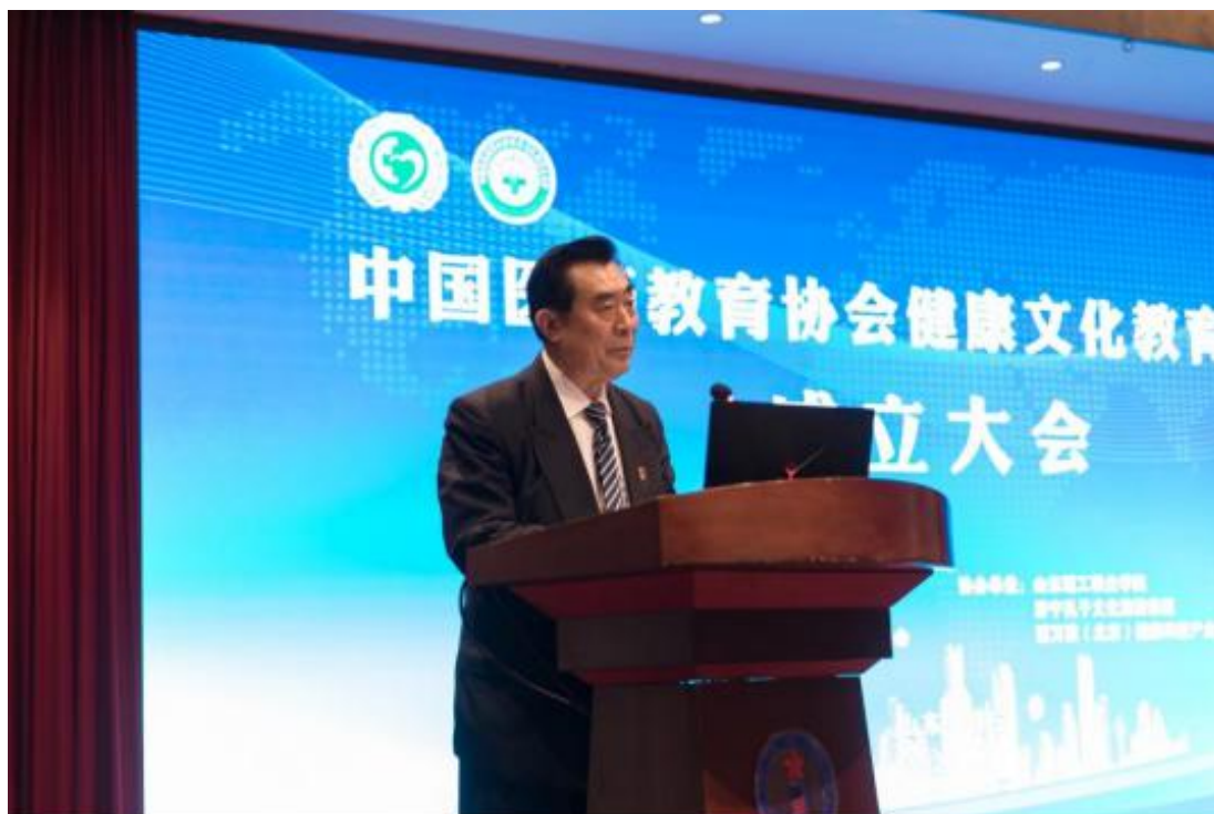
中国医药教育协会会长黄正明发表讲话