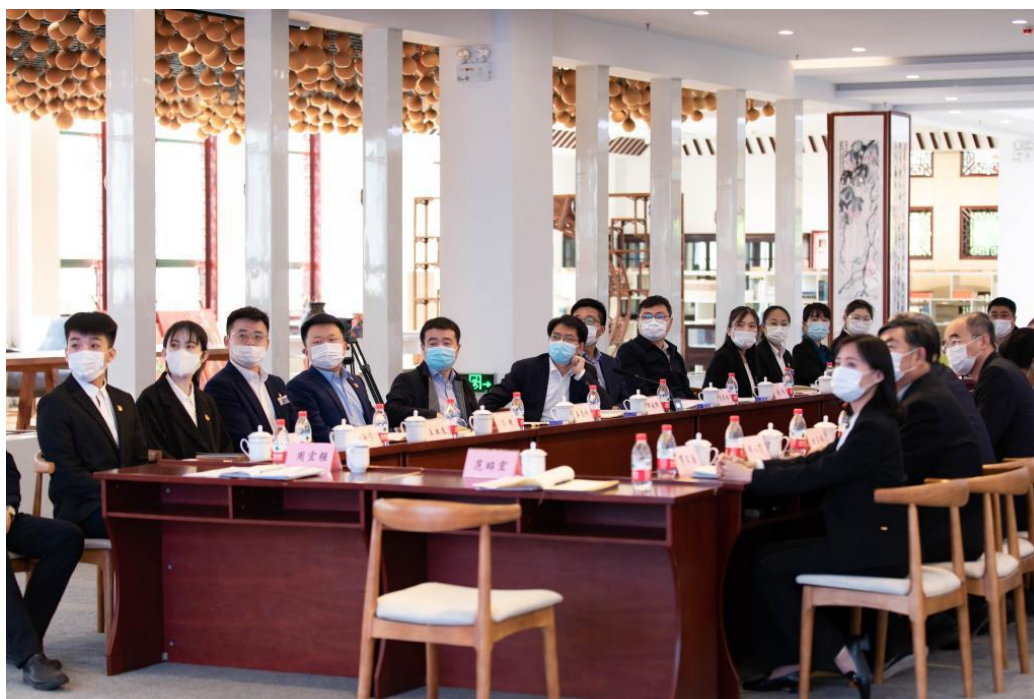
观看学院《大美理工成就大国工匠》宣传片

起来，通过弹性匹配、动态共享给产业需求方的新模式新业态表示肯定和支持；在融媒体中心，邓厅长察看了我院自主编写的9个专业领域《工业汉语》教材，听取了我院赋能央企海外办学、建设海外职业技术学院、推广“中文+职业技能”的工作介绍。