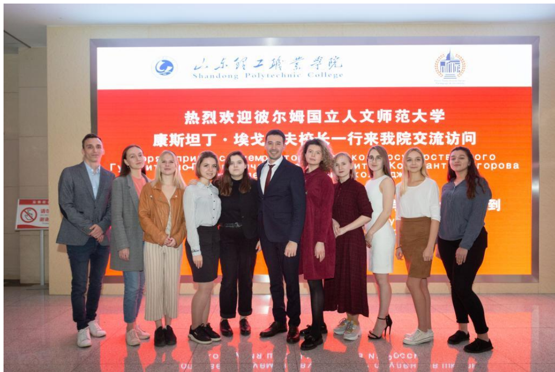
首批俄罗斯国际学生入学报到

生们在文化节期间参加了各种活动，开幕式上为大家带来了俄罗斯传统歌舞表演并在“在理工遇见世界”国际周上与其他国家国际学生载歌载舞共建友谊桥梁。