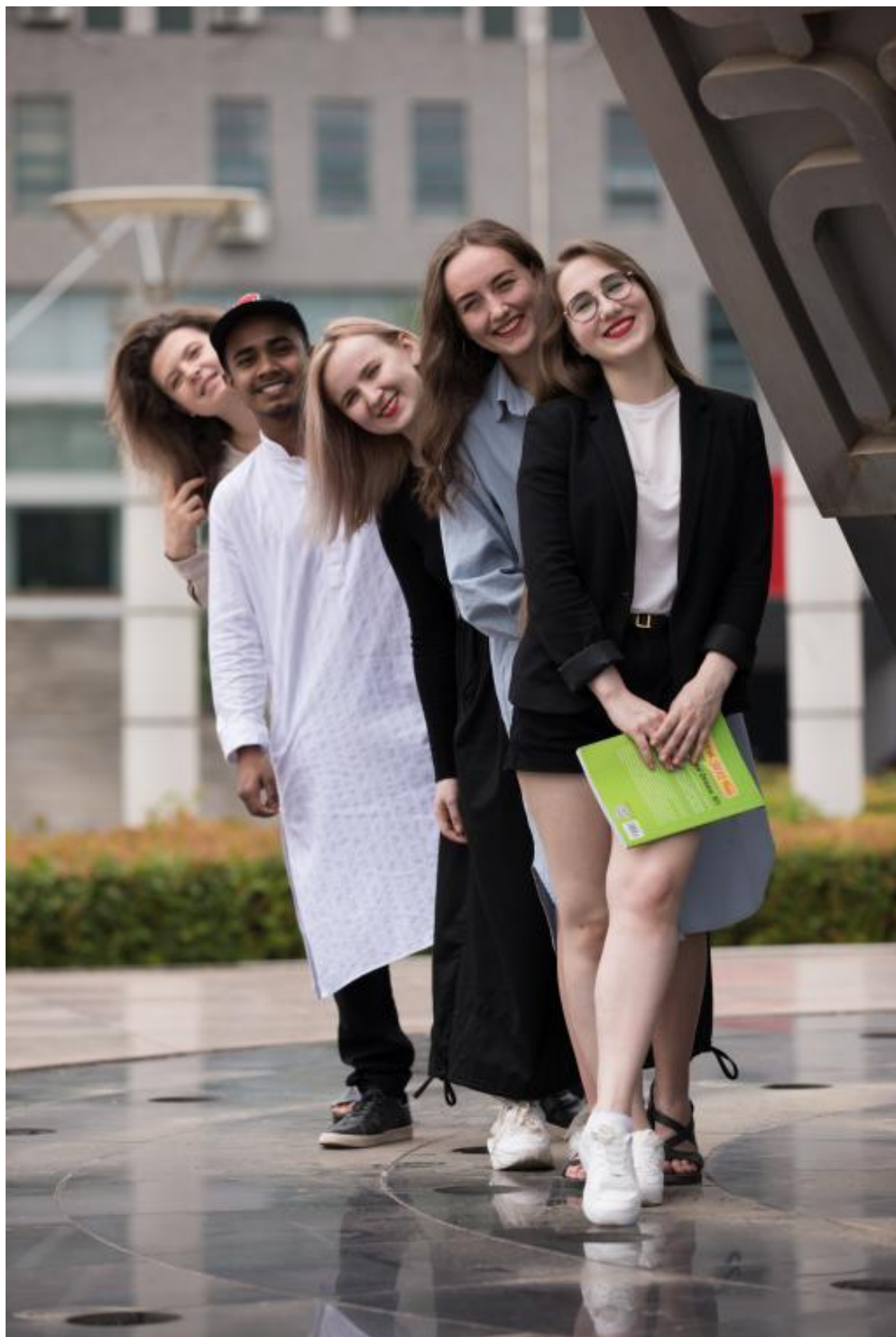
俄罗斯国际学生在校学习生活照