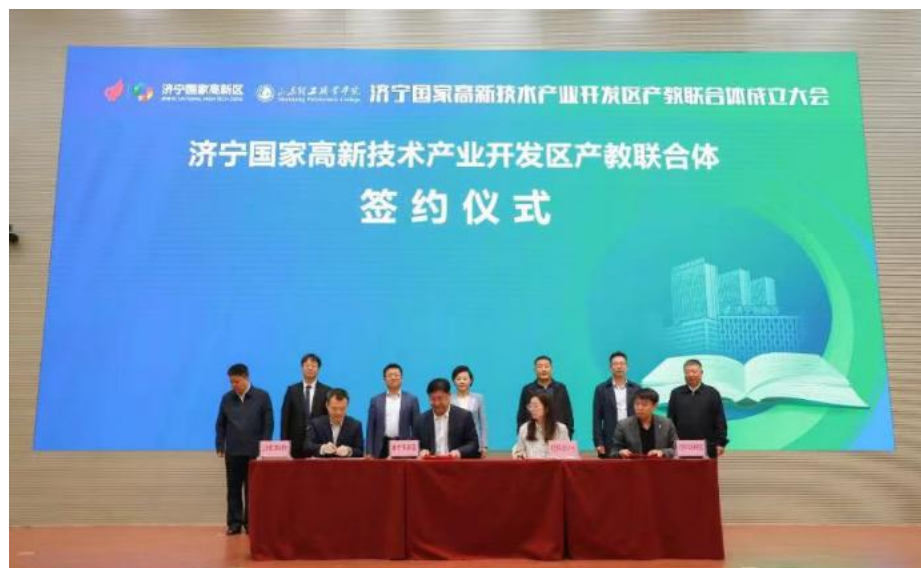
济宁国家高新技术产业开发区产教联合体签约仪式现场

校院所在更广领域开展务实合作，孵化更多创新项目，培育更多创新人才，实现人才和产业的良性互动，早日结出合作共赢新硕果。