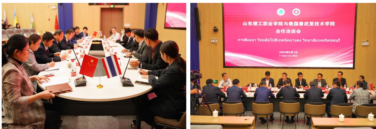
山东理工职业学院与泰国春武里技术学院合作洽谈会现场

当前，推进职业教育与国际中文教育融合发展，培养更多懂汉语、精技术的复合型人才，将成为国际中文教育未来发展的新着力点与新趋势。未来，我校也将继续发挥“中文+职业技能”教学优势，聚焦中文教育，服务职业教育，培养更多复合型人才，努力为促进中外人文交流、增进世界各国人民相互了解作出更大贡献。