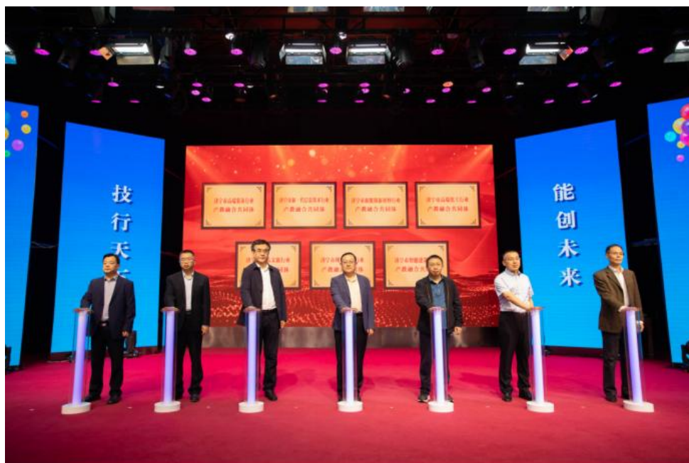
与会领导为济宁市高端装备等七个行业产教融合共同体揭牌

市教育局、市财政局、市工信局、市能源局、市文旅局、济宁银保监分局、市建设工程管理服务中心等部门的相关领导共同上台为济宁市高端装备、新一代信息技术、新能源新材料、高端化工、精品文旅、现代金融、智能建筑等七个行业产教融合共同体揭牌。