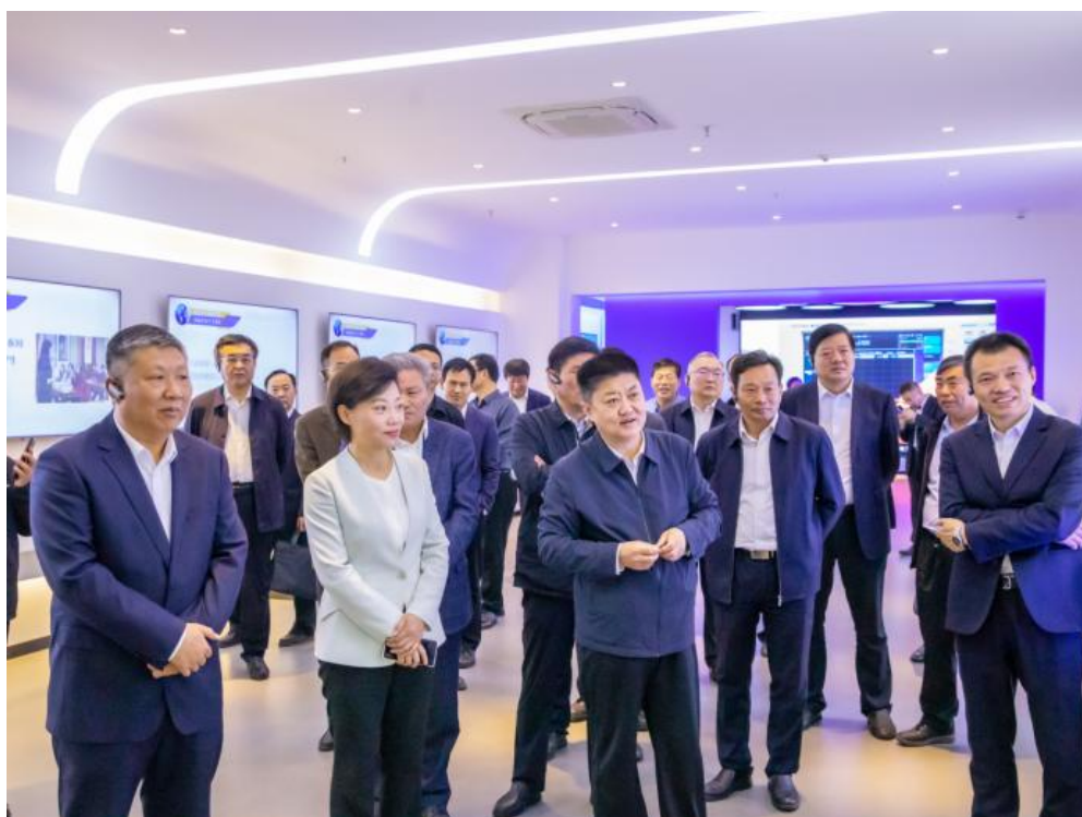
与会领导参观了山东理工职业学院实训中心