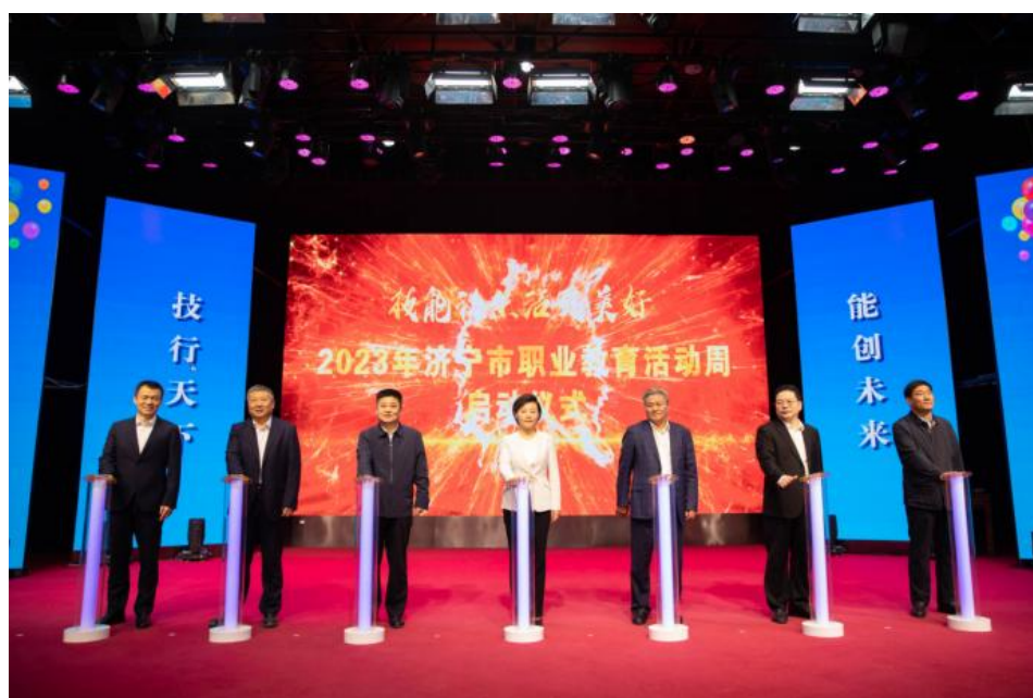
与会领导共同启动济宁市职业教育活动周

市教育局、市财政局、市工信局、市能源局、市文旅局、济宁银保监分局、市建设工程管理服务中心等部门的相关领导共同上台为济宁市高端装备、新一代信息技术、新能源新材料、高端化工、精品文旅、现代金融、智能建筑等七个行业产教融合共同体揭牌。