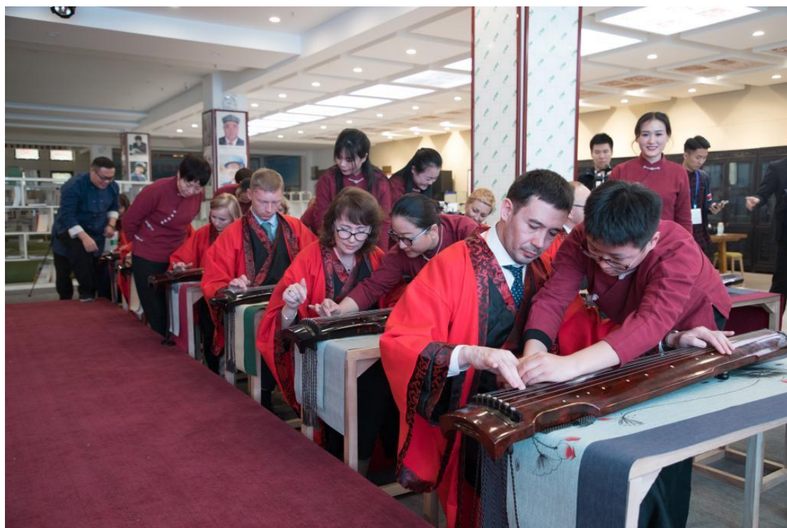
外国师生在悠悠古琴声中聆听中国传统文化