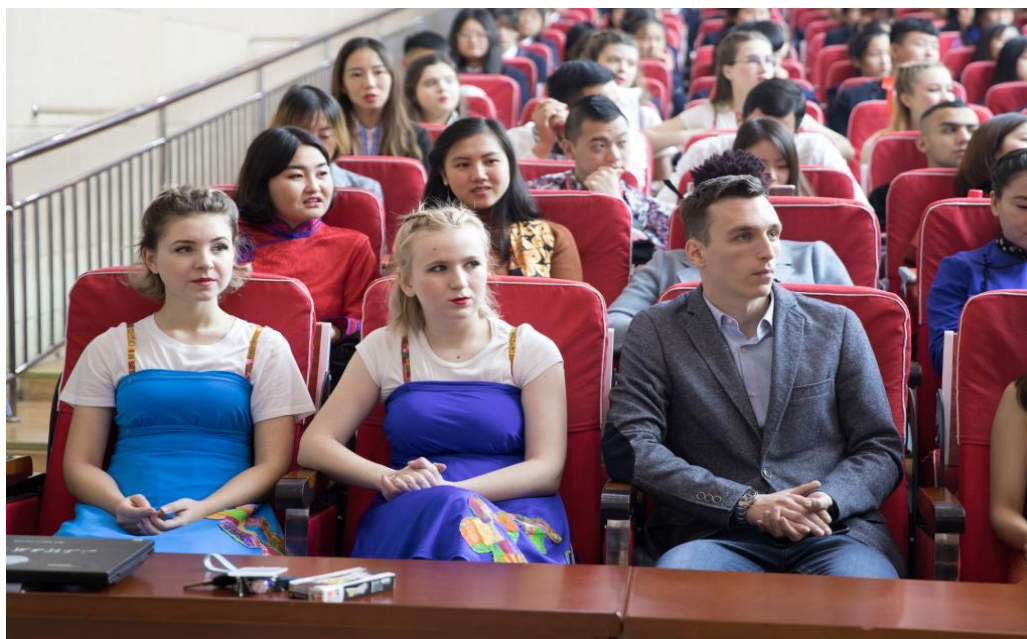
我院的国际学生参加了开幕式