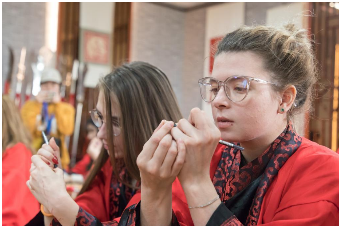
山东理工职业学院留学生体验“米雕”，在花生上写字