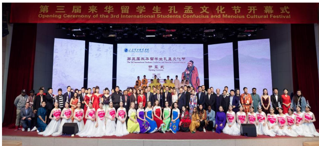
开幕式结束后，与会嘉宾合影留念