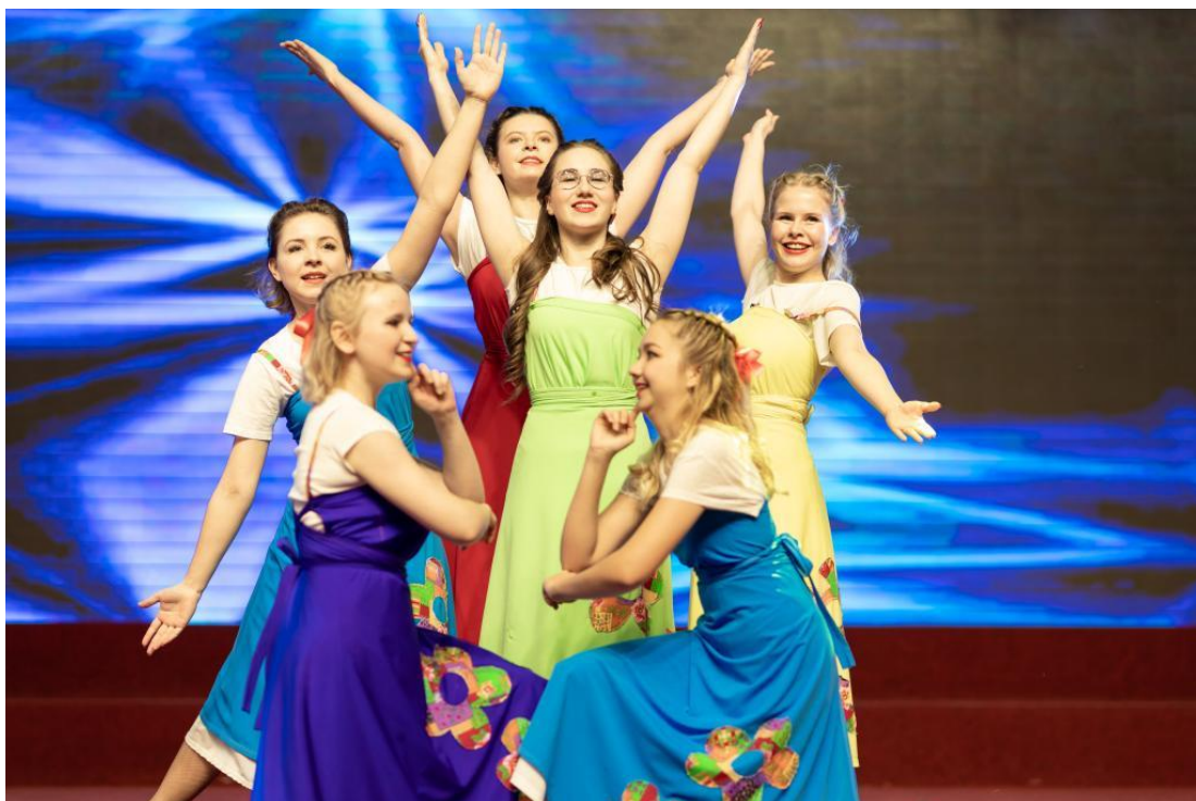
来自俄罗斯的留学生带来了本国的民族舞蹈

生孔孟文化节。据了解，今年的文化节学院还将组织举行“一带一路”国际化人才培养报告会、中国传统文化培训、职业教育培训、孔孟故里游学、“在理工遇见世界”国际周等系列活动，让留学生、外国来宾更深入地体验中华优秀传统文化的内涵和魅力，为服务“一带一路”沿线国家人文交流和教育合作贡献力量。