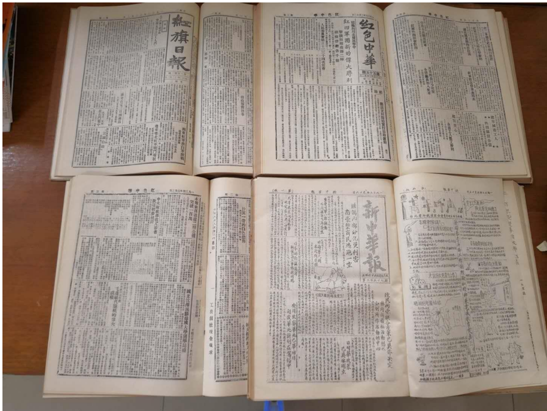
学院图书馆珍藏的《红旗日报》和《红色中华》