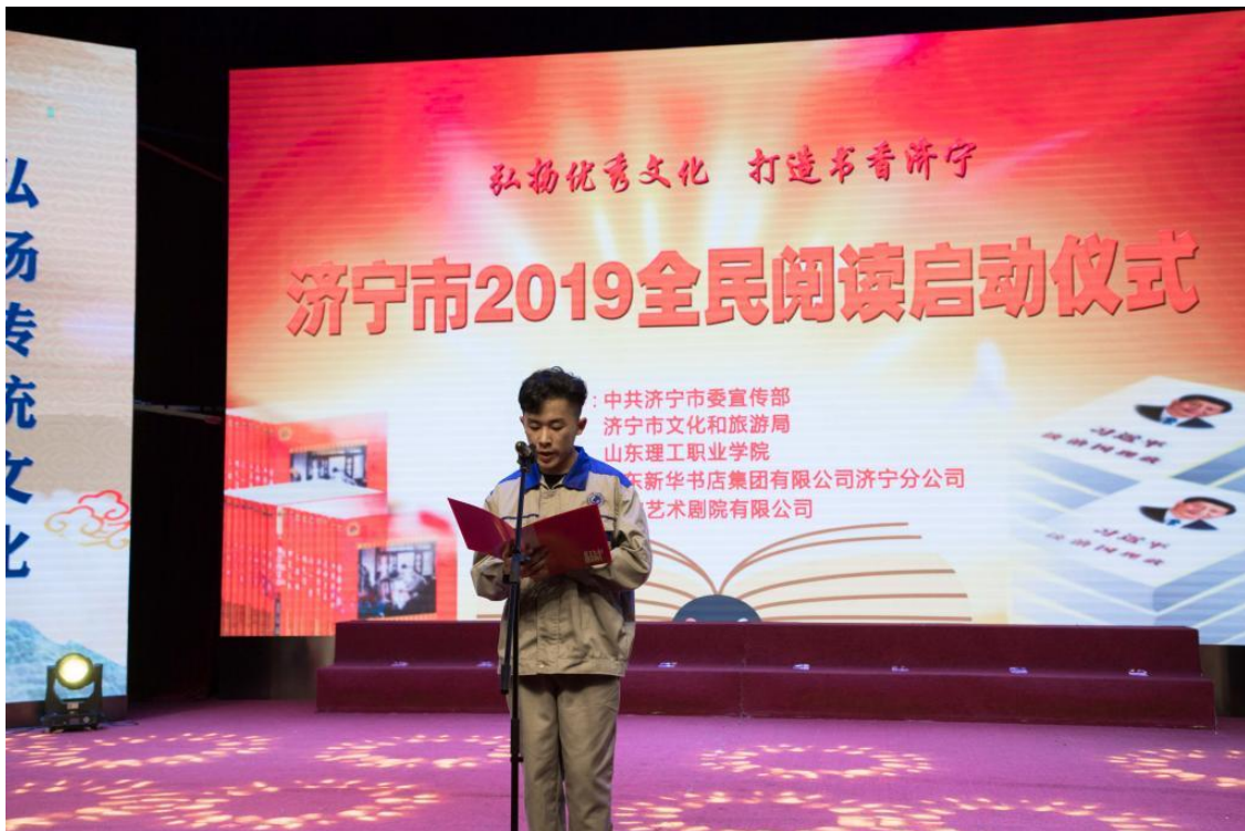
学生代表宣读全民阅读倡议书