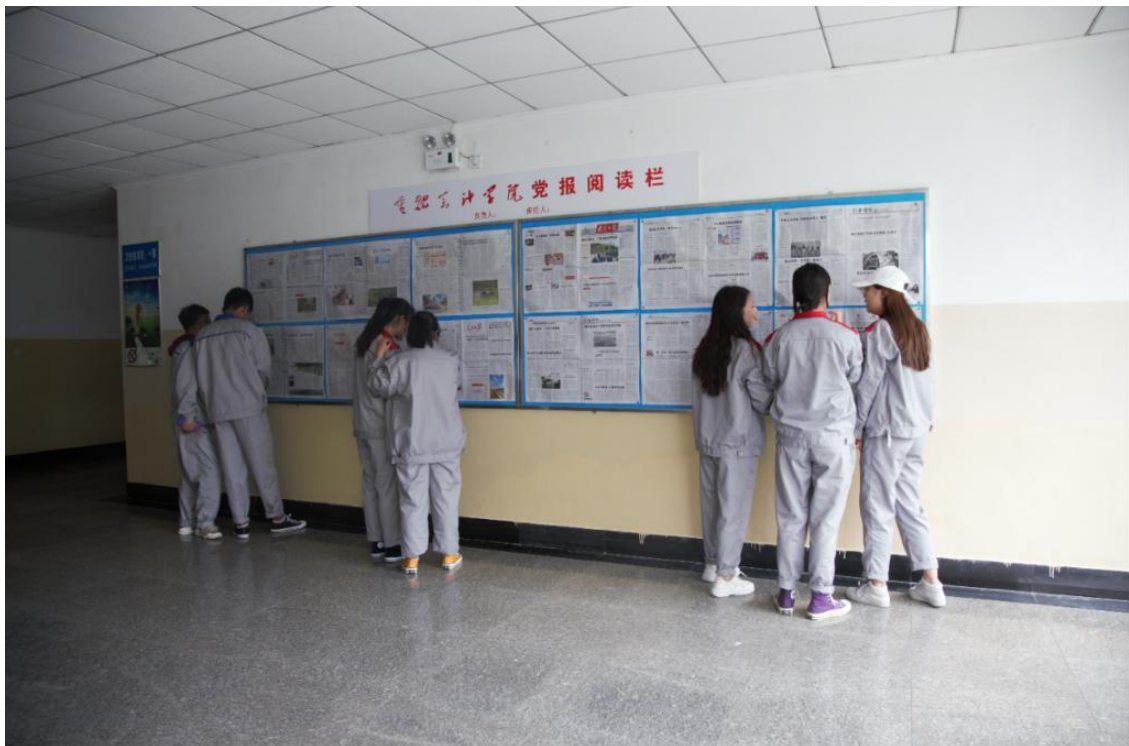
学生课余时间在党报宣传栏阅读