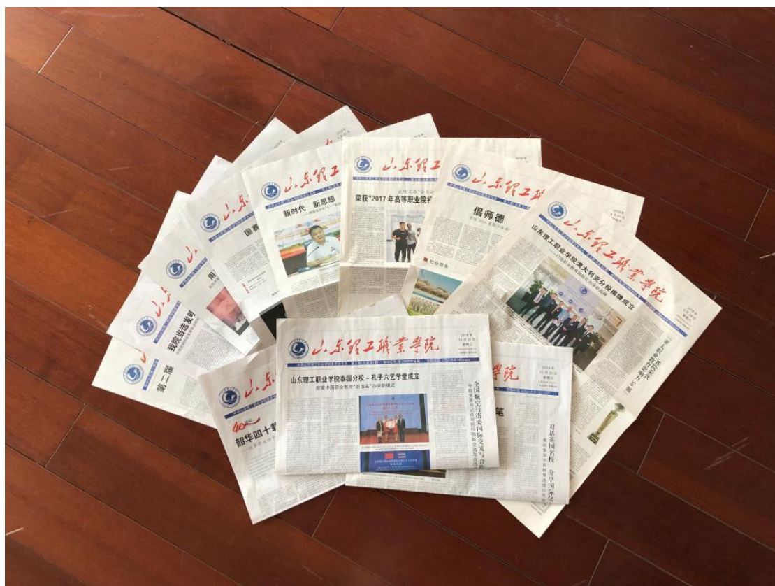
山东理工职业学院院报已成为学院独特的育人平台